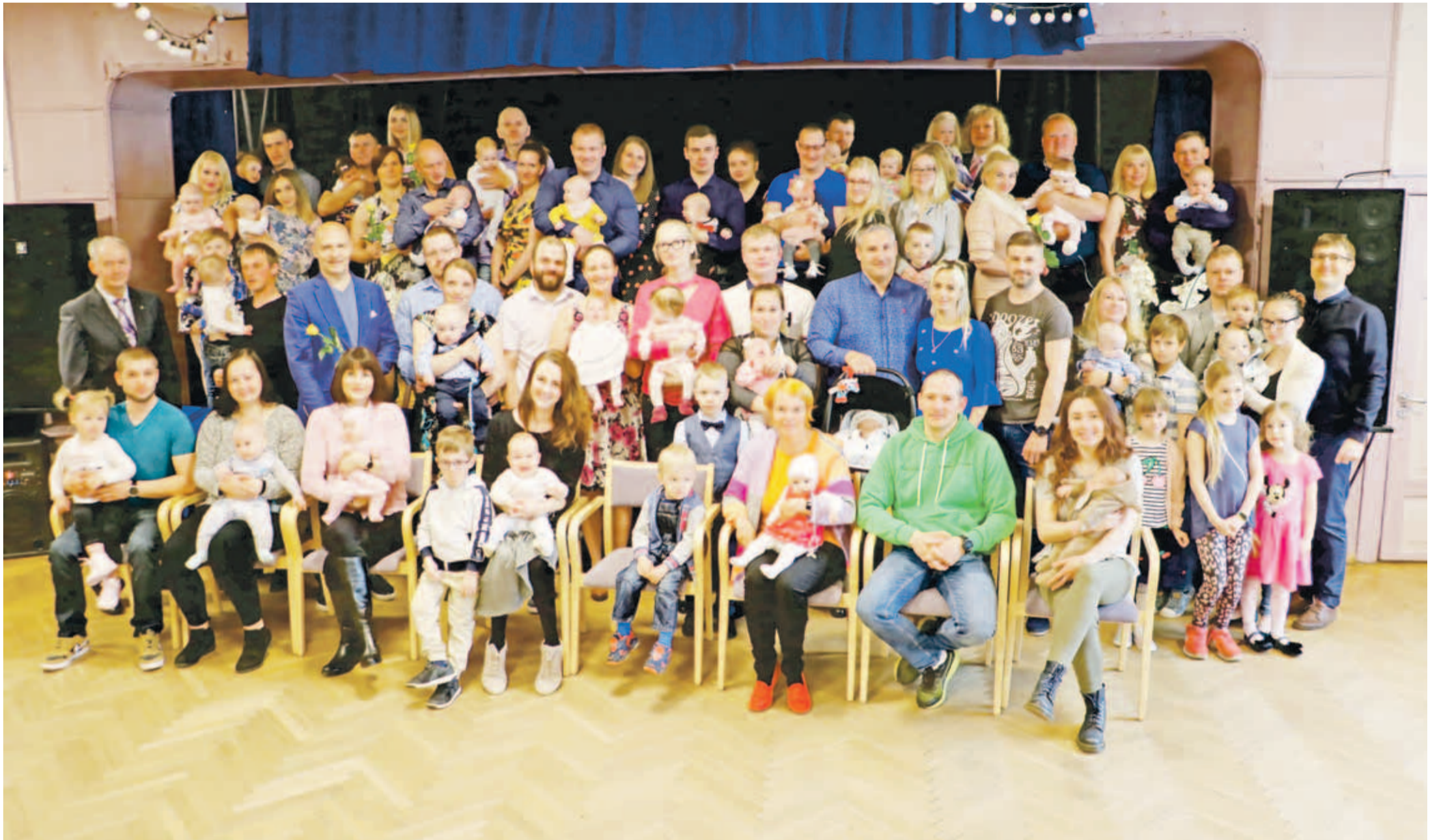
Emadepäeva eel tervitati Jõelähtme rahvamajas kõige värskemaid vallakodanikke. Lusikapeol said omanimelise lusika ja juturaamatu kätte 39 beebit, kellest 21 olid tüdrukud ja 18 poisid.