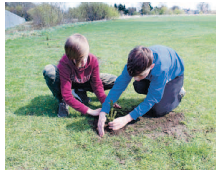
Kostivere kooli õpilased istutasid üheskoos kooli aia taha 101 kuuske.