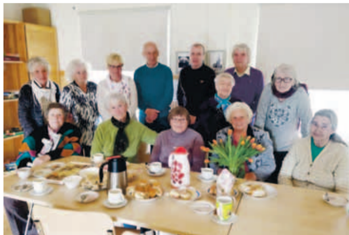
Ühine sünnipäevade tähistamine Kaberneeme rahvamajas.

Sisseastumisavaldused täita eelnevalt ning saata e-mailile info@joelahtmemkk.ee. Kunstiosakonna põhikooli võtame õpilasi vastu ilma katseteta. Sisseastumisavaldusi võib esitada 26. augustini e-mailile info@joelahtmemkk.ee. Sisseastumisavaldused leiate kooli kodulehelt www.joelahtmemkk.ee rubriigi „Dokumendid” alt. •