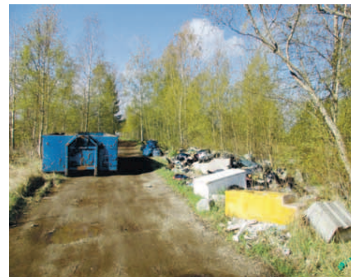
Pilpaküla koristustalgutel koguti kokku ja viidi minema rekordiline kogus prügi.